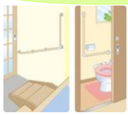
段差解消・手すり設置等