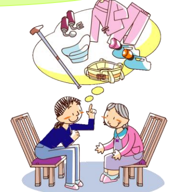
適切なアドバイス